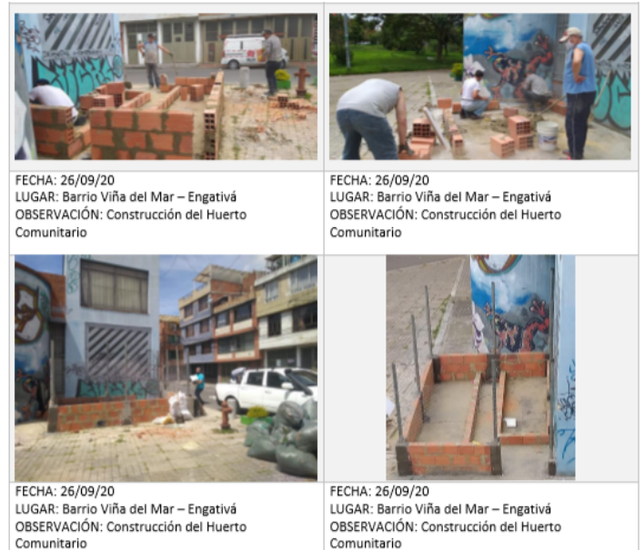
FECHA: 26/09/20 LUGAR: Barrio Viña del Mar – Engativá OBSERVACIÓN: Construcción del Huerto Comunitario