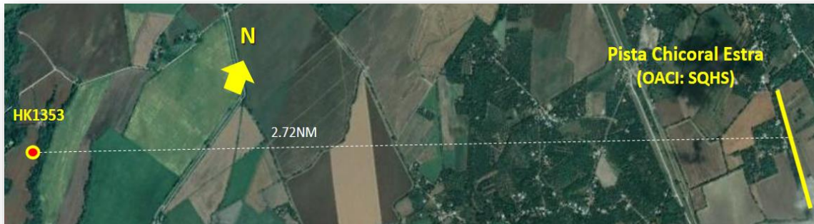
Figura No. 2 – Ubicación de la aeronave HK1353 y la Pista Chicoral Estra (OACI: SQHS)