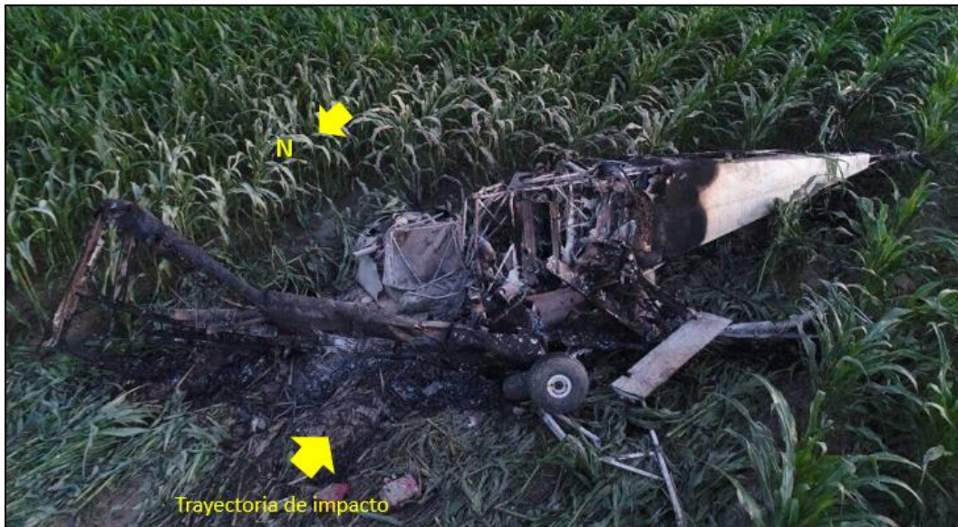
Fotografía No. 1 – Estado final de la aeronave HK1353

Como consecuencia de la colisión, se presentaron lesiones mortales en el Piloto y fuego post impacto que consumió gran parte de la aeronave la cual quedó totalmente destruida.