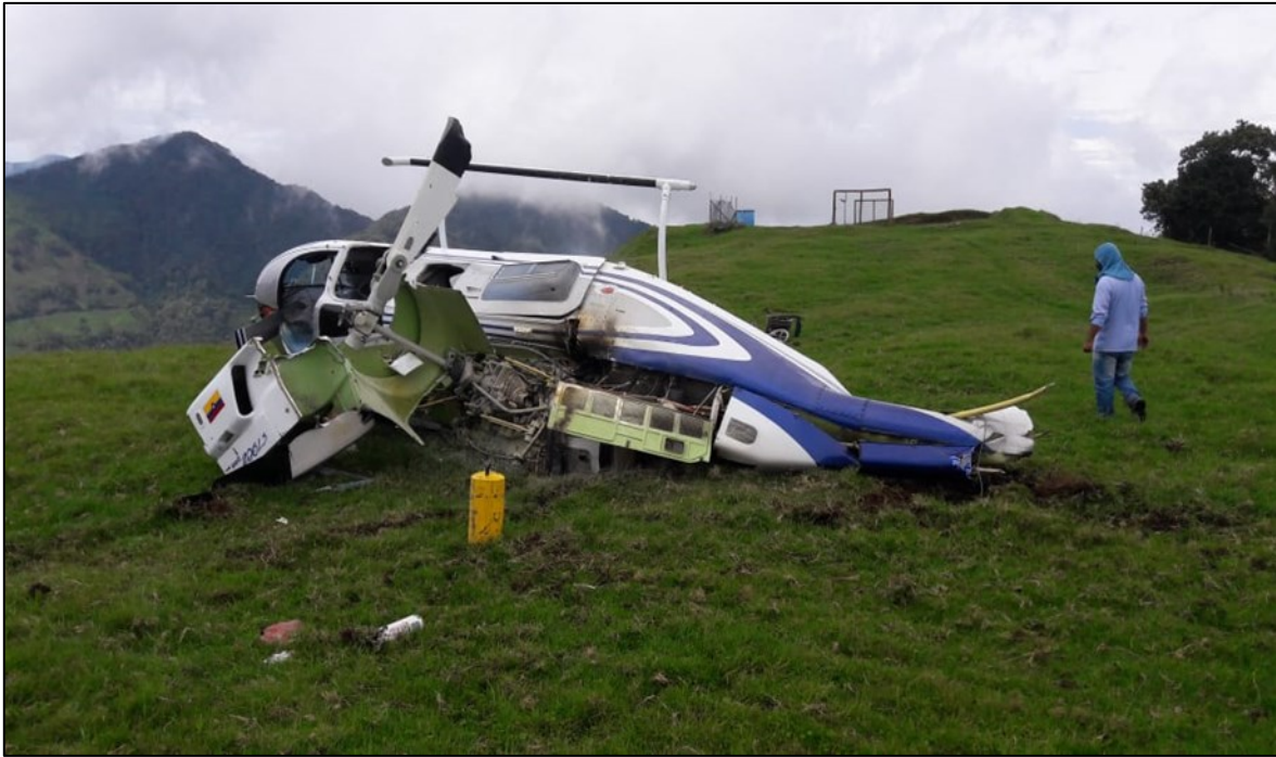
Fotografía No. 1: Posición final de la aeronave HK3312

La Autoridad de Investigación de Accidentes (AIA) de Colombia (Grupo de Investigación de Accidentes – GRIAA) tuvo conocimiento del accidente a las 10:40 HL (15:40 UTC) y se ordenó el desplazamiento de un Investigador desde la ciudad de Bogotá, al sitio del accidente.