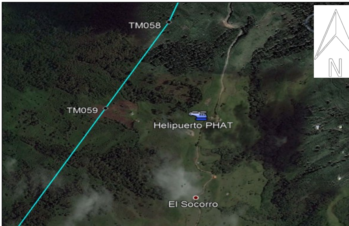
Figura No. 2: Helipuerto acondicionado para el descargue

Nombre: Sabanalarga Altura: 8240 ft Coordenadas: 6°54'51.42"N 75°46'19.43"W Superficie: Césped