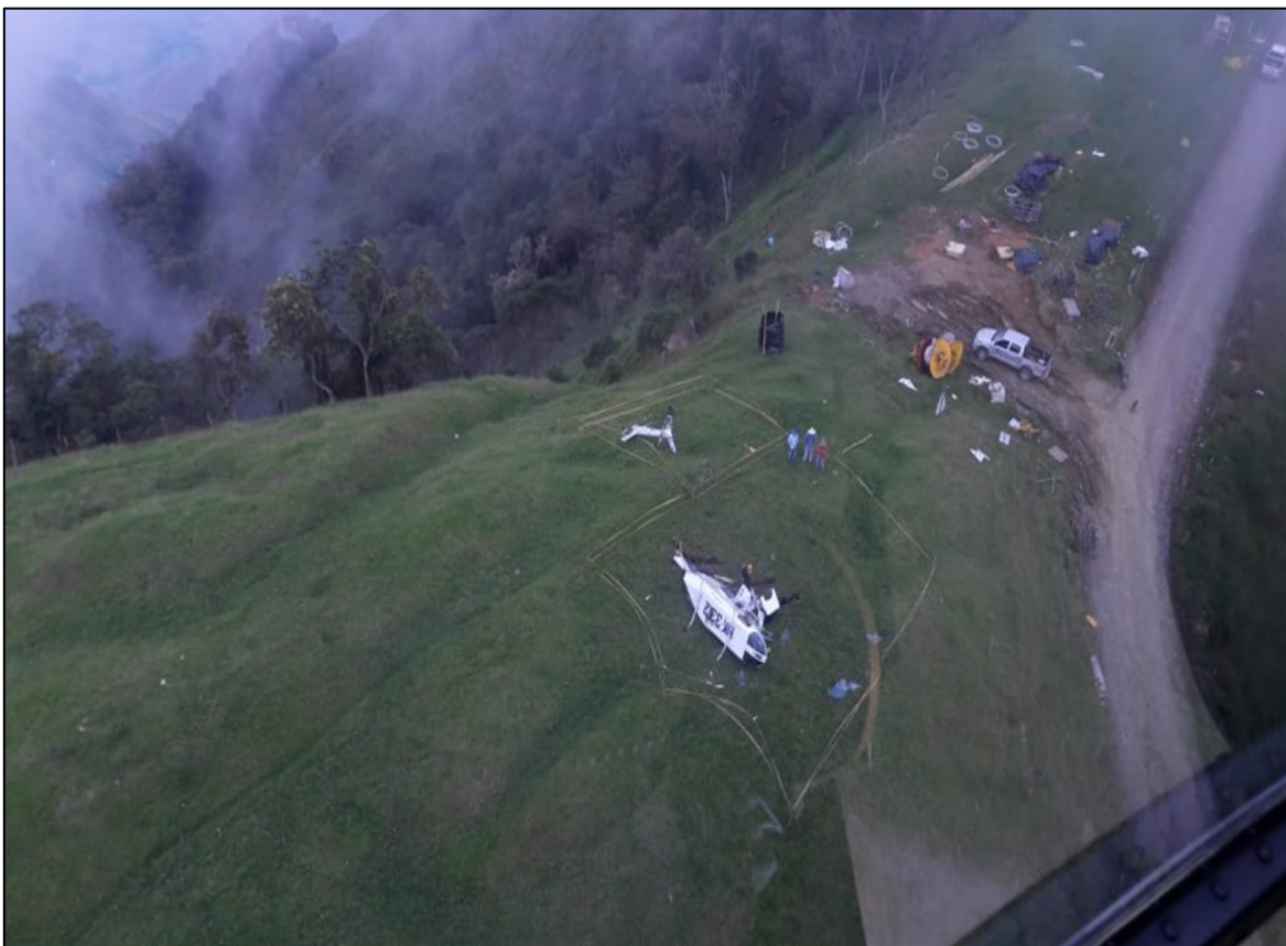
Fotografía No. 2: Área general del accidente