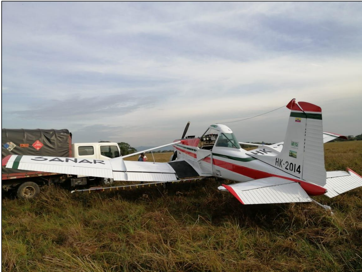
Fotografía 01: Condición final de la Aeronave HK2014

Se evidenciaron daños preliminares en el cárter del motor por la explosión. La aeronave no sufrió ningún daño. Dentro de las actividades adelantadas, se efectuó el recaudo y custodia de la documentación a bordo.