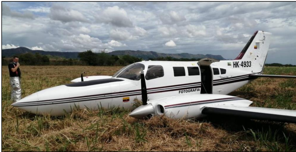
Fotografía No. 1 – Posición final aeronave HK4833

No se presentó incendio. El incidente Grave ocurrió a las 13:14 HL, con luz de día y condiciones VMC.