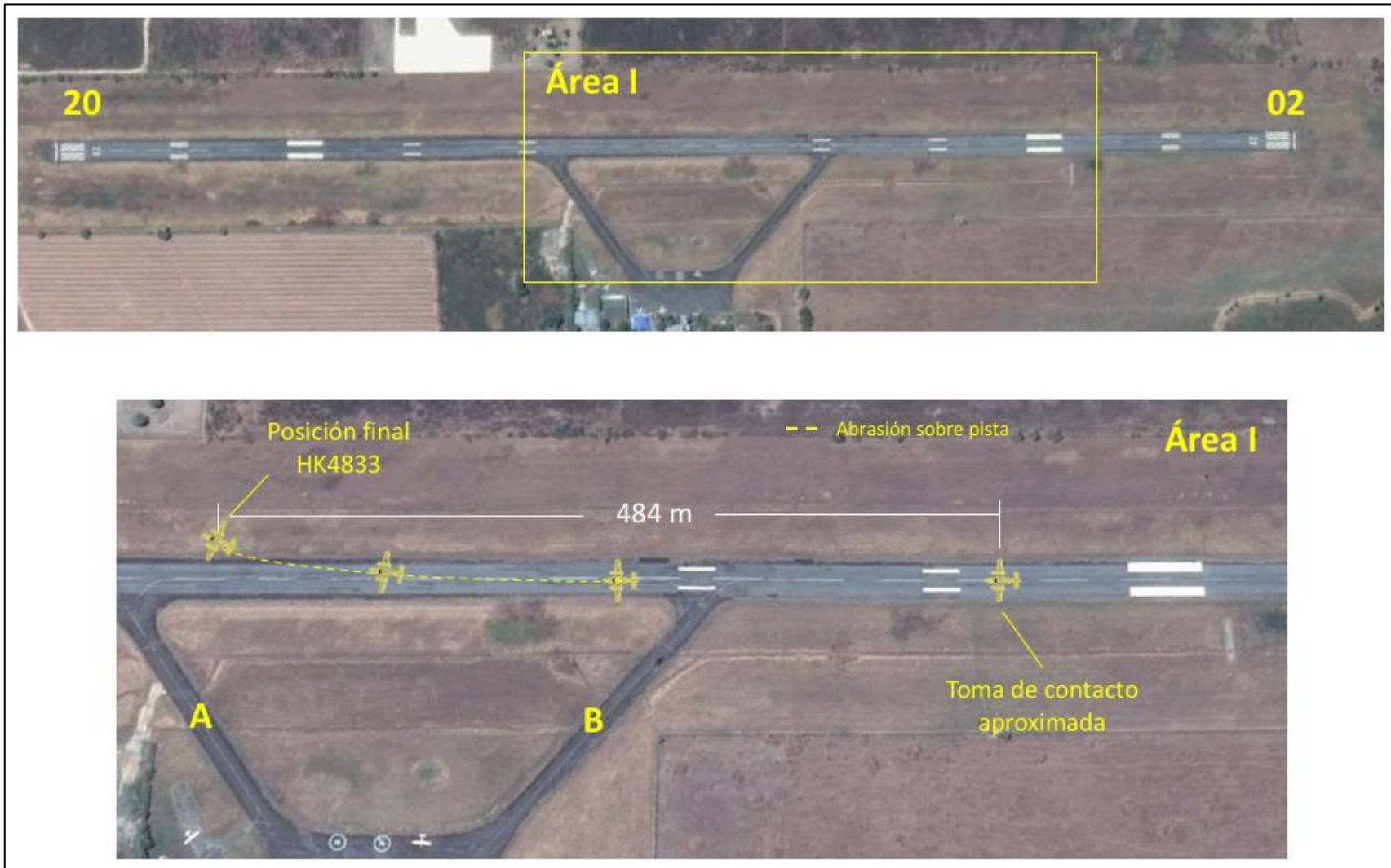
Imagen No. 2 – Posición final aeronave HK3065