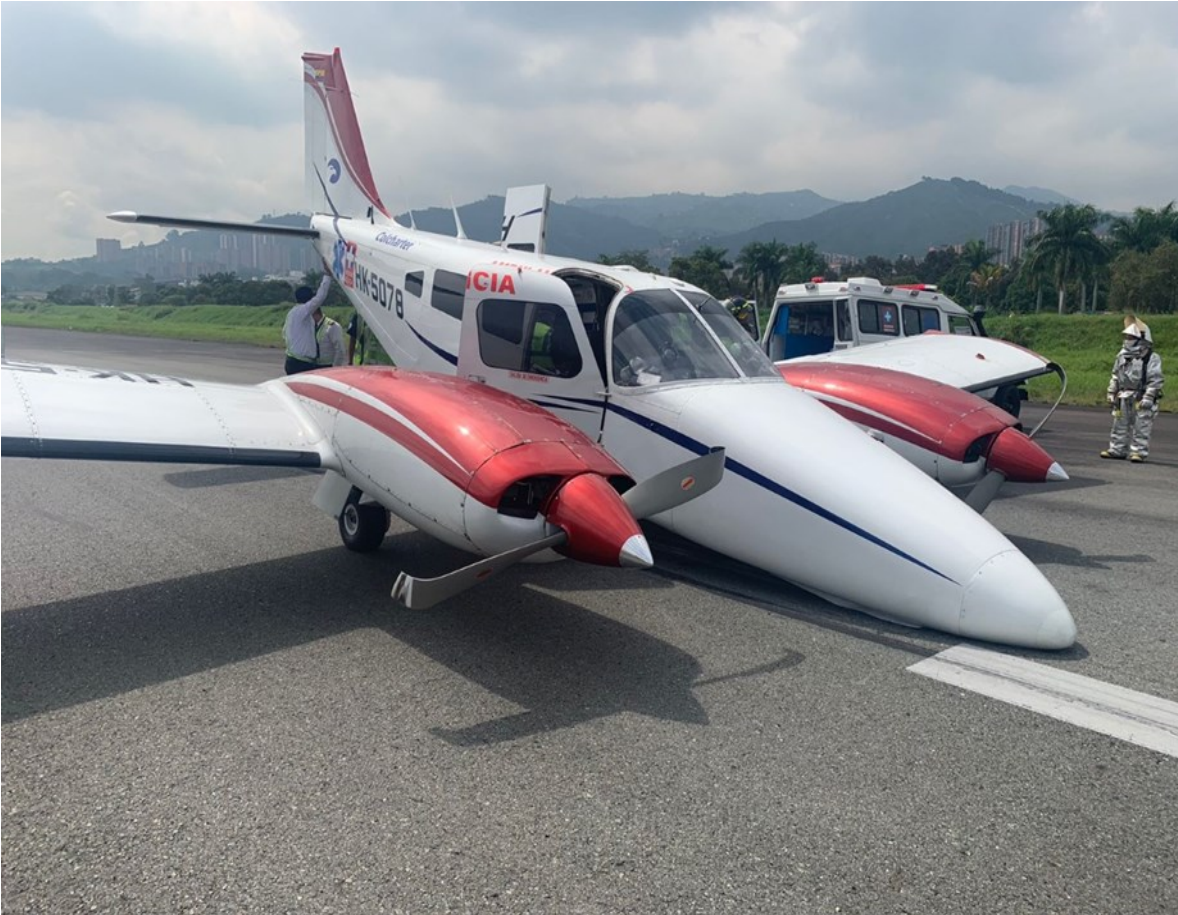
Fotografía No. 1 - Posición final de la aeronave posterior a la retracción del tren.