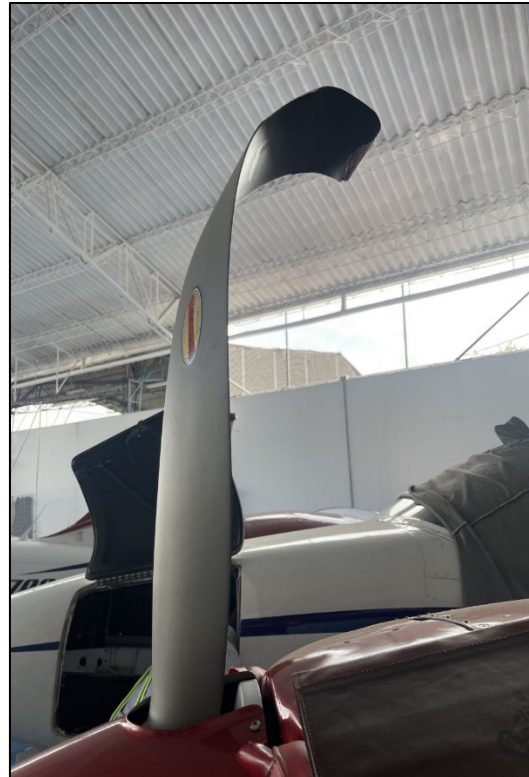
Fotografías No. 3 y 4 - Daños en el morro del avion y en las palas de las hélices.