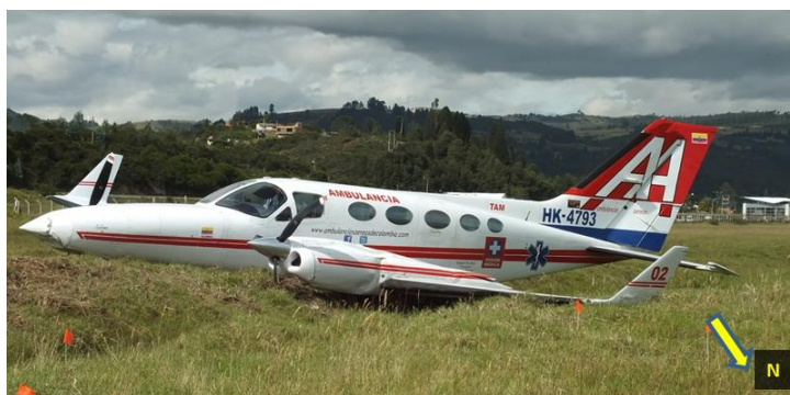
Estado Final de la Aeronave HK4793

La investigación se encuentra en proceso de obtención documental y en coordinaciones para la inspección (Análisis de Falla) del conjunto del tren principal izquierdo. Al momento de emisión del presente informe preliminar se notificó a la National Transportation Safety Board (NTSB) quien asignó un Representante Acreditado para asistir la investigación que adelanta el GRIAA. Información actualizada el día 21 de Julio de 2015, 15:00 UTC (10.00 HL).