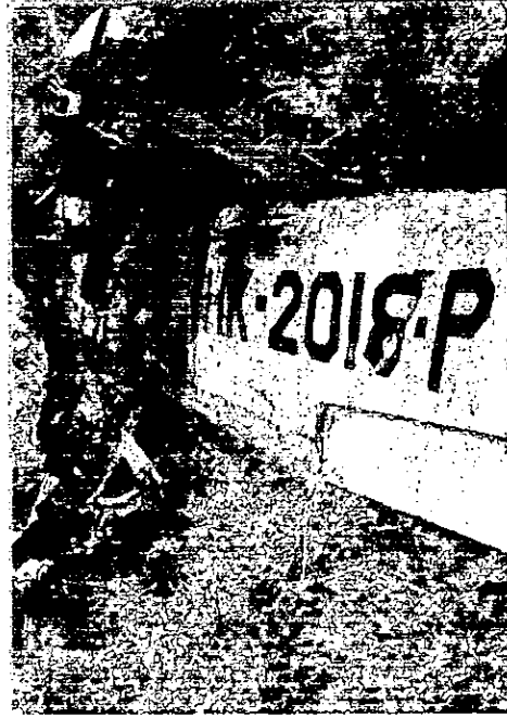
PATRON PROPAGACIÓN INCENDIO-(DE LA CABINA HACIA PLANOS Y FUSELAJE)