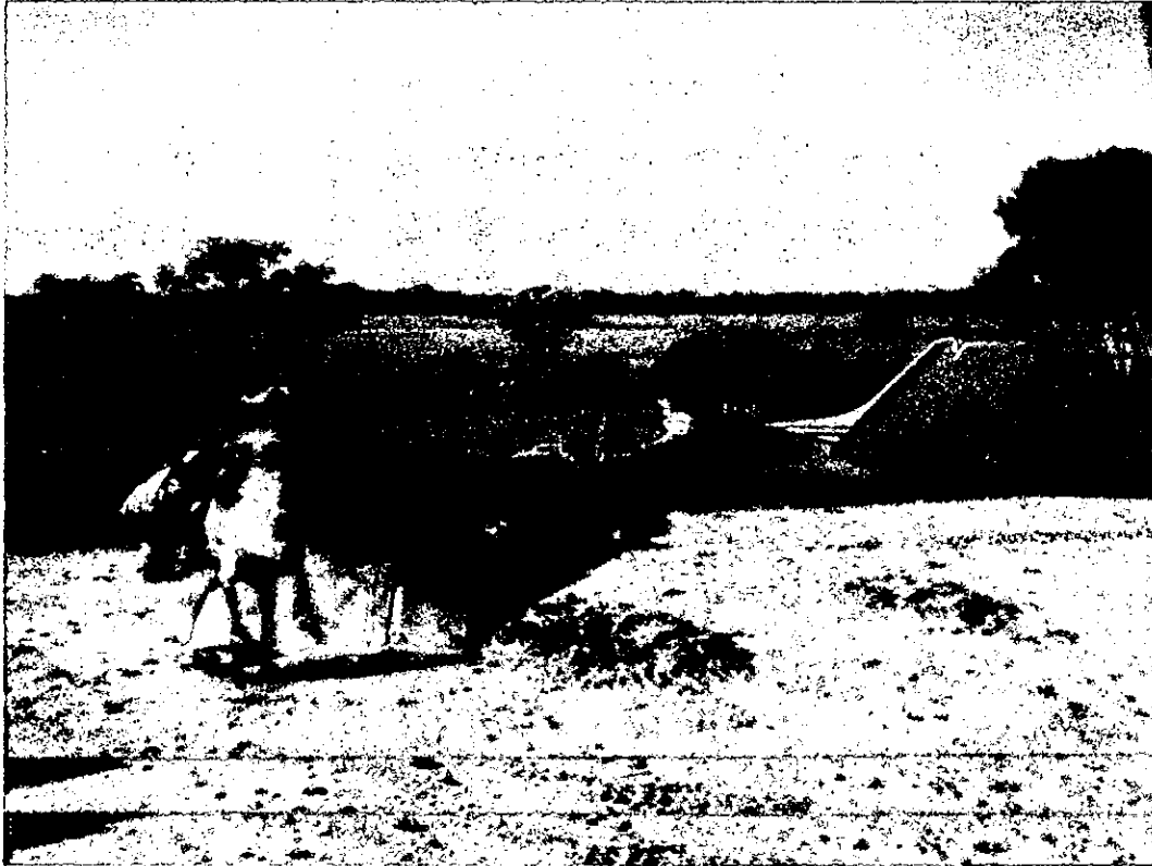
CONDICION DE LA AERONAVE POSTERIOR AL INCENDIO