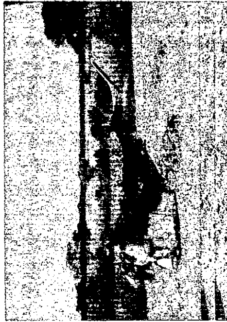
CONDICION DE LA AERONAVE POSTERIOR AL INCENDIO