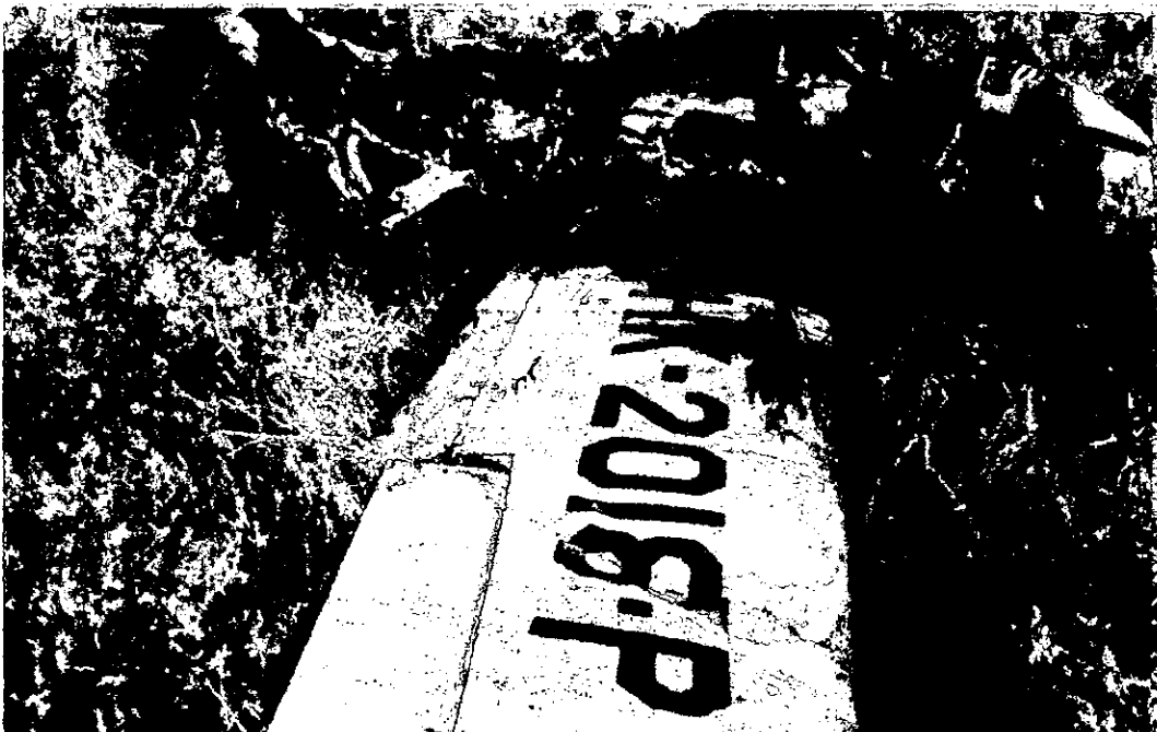
PATRON PROPAGACION INCENDIO- DE LA CABINA HACIA PLANOS Y FUSELAJE