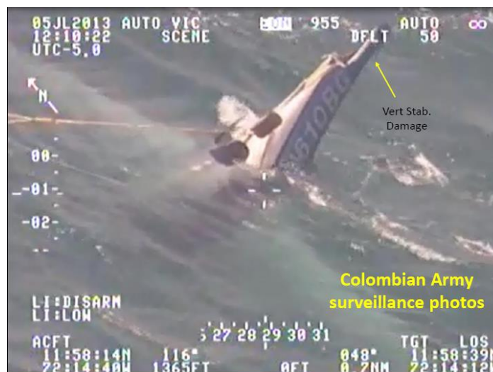
Vista general del N-610BG posterior al impacto en el mar

El N-610BG , perdió en vuelo sus estabilizadores vertical y horizontal y una vez cayó en el mar de manera controlada aunque no sufrió destrucción, si tuvo pérdida total debido a las características del accidente.