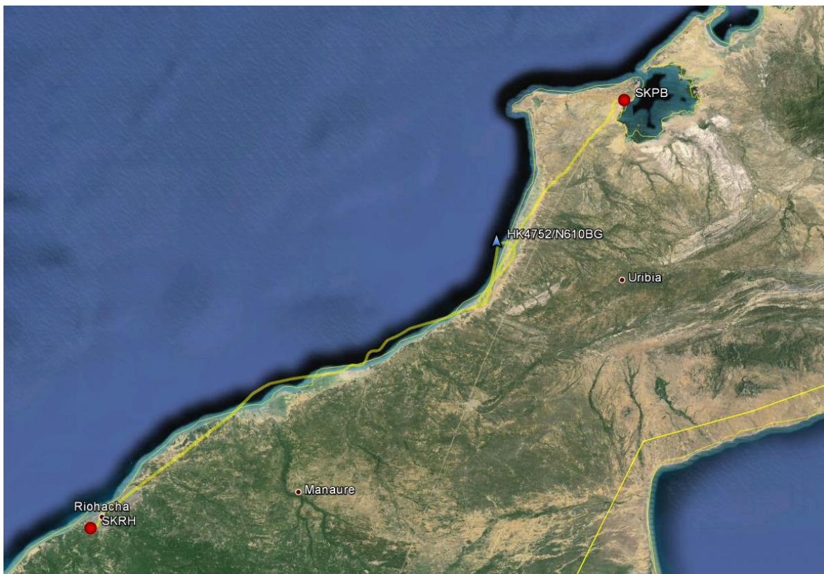
Imagen lugar aproximado de la colisión de ambas aeronaves y la relación de los aeródromos de despegue y aterrizaje de emergencia

El N-610BG luego de la colisión con el HK-4752, debido a la pérdida de superficies de sustentación esenciales para el vuelo, perdió el control y se precipitó al mar en picada, el piloto activo el sistema CAPS (Cirrus Airframe Parachute System) desplegando el paracaídas que finalmente permitió la supervivencia de la tripulación.