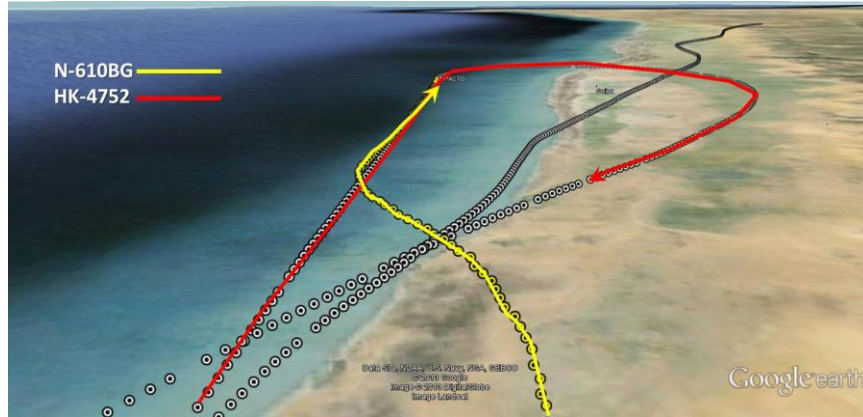
Vista de las últimas trayectorias antes de la colisión