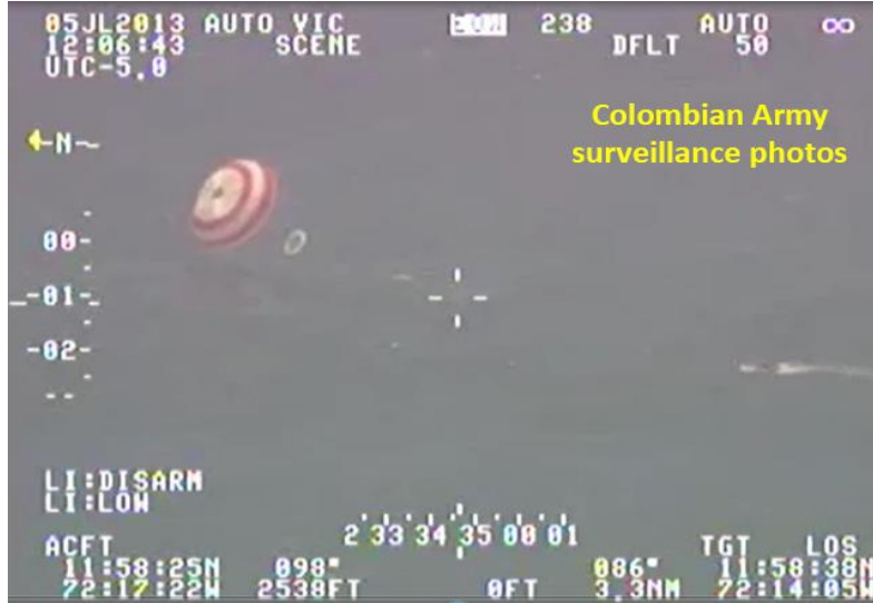
Imágenes de la aeronave de reconocimiento de la Armada Nacional