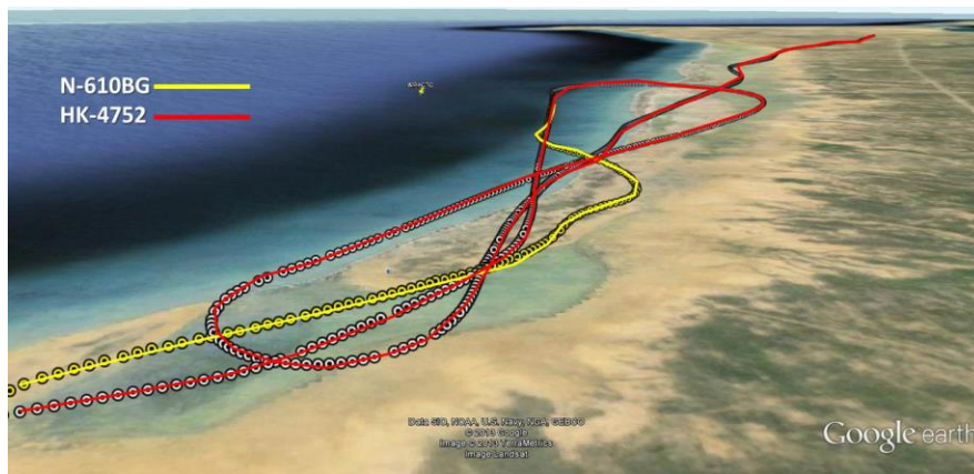
Trayectoria general de vuelo descrita por las dos aeronaves

Los ocupantes del N-610BG fueron rescatados por una embarcación y llevados a la costa.