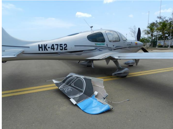
Condición final de la aeronave HK4752, Luego del aterrizaje en Puerto Bolívar (Guajira)