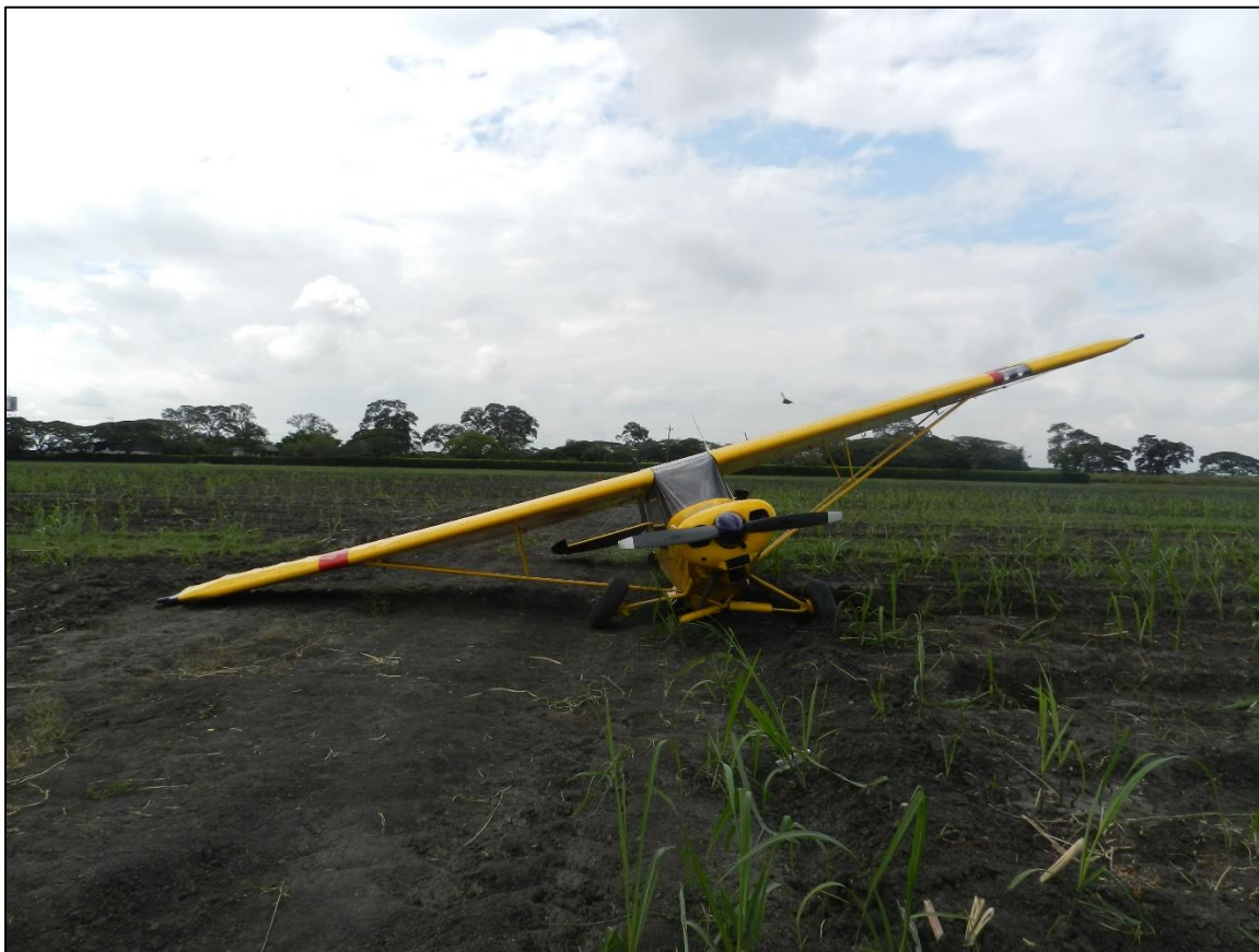
Fotografía No. 2 Estado final de la aeronave HJ-354

En horas de la mañana del 20 de enero de 2019, se desplazó una (01) Investigadora del GRIAA al sitio del incidente con el fin de adelantar la inspección de campo y obtener las declaraciones del Piloto al mando involucrado en el evento.