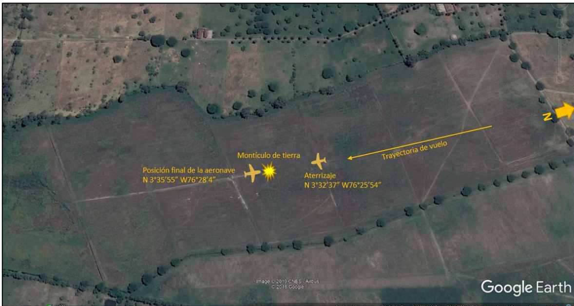
Figura No. 1 Croquis general del evento

Condiciones meteorológicas visuales y favorables prevalecían al momento de accidente.