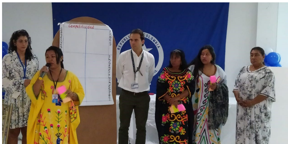
Tabla 72. Principales Resultados árbol de necesidades aeropuerto de Riohacha: Infraestructura, Sostenibilidad Ambiental e Institucionalidad