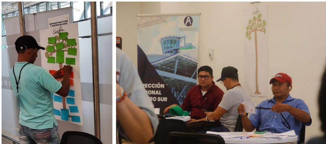
Tabla 5. Principales Resultados árbol de necesidades aeropuerto Vásquez Cobo de Leticia: Seguridad Operacional y de la Aviación Civil e Industria Aeronáutica y Cadena de Suministro

la información necesaria de su vuelo planteándose la necesidad de colocar pantallas que permitan ver la información sobre los itinerarios.