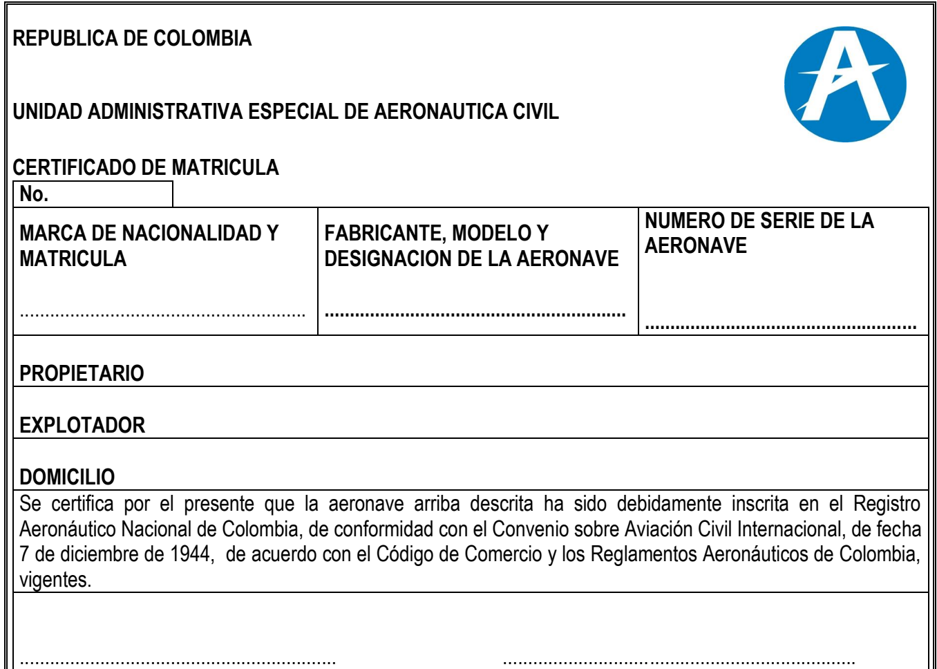
Figura 1b. Certificado de Matrícula.